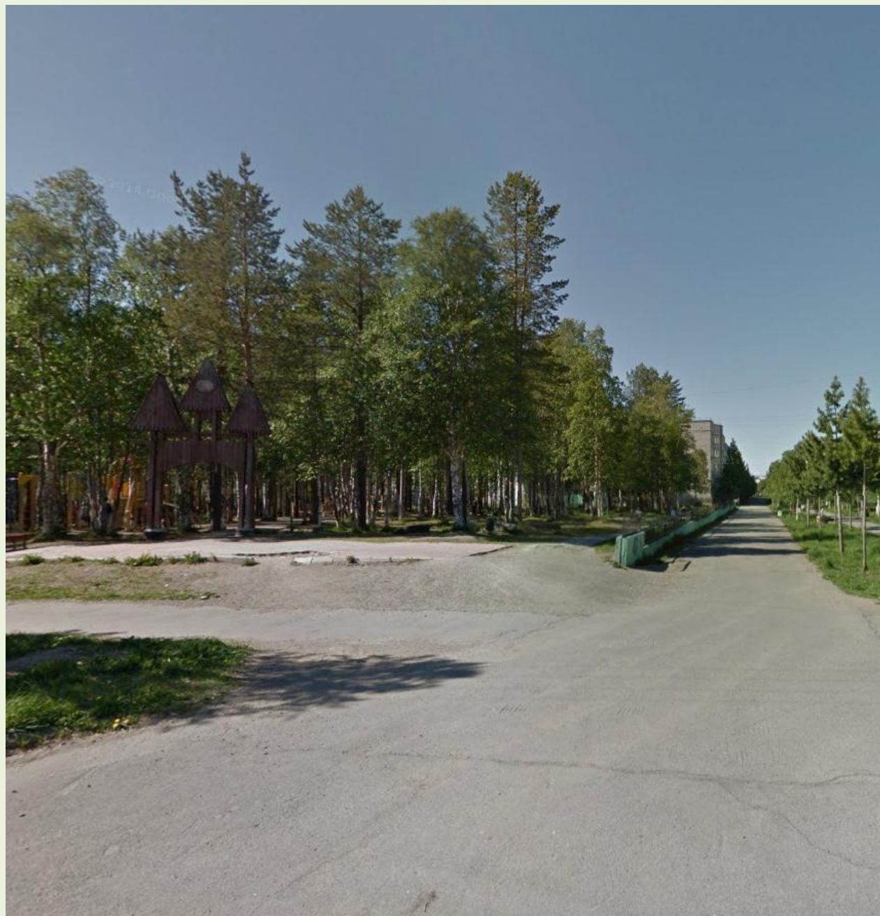
Парк по улице Пушкина в городе Апатиты (текущее состояние)